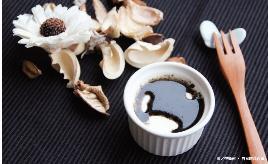
圖/空幾何·自然時蔬百匯