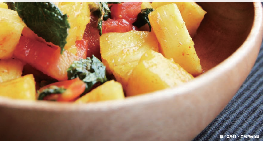
圖／空幾何・自然時蔬百匯